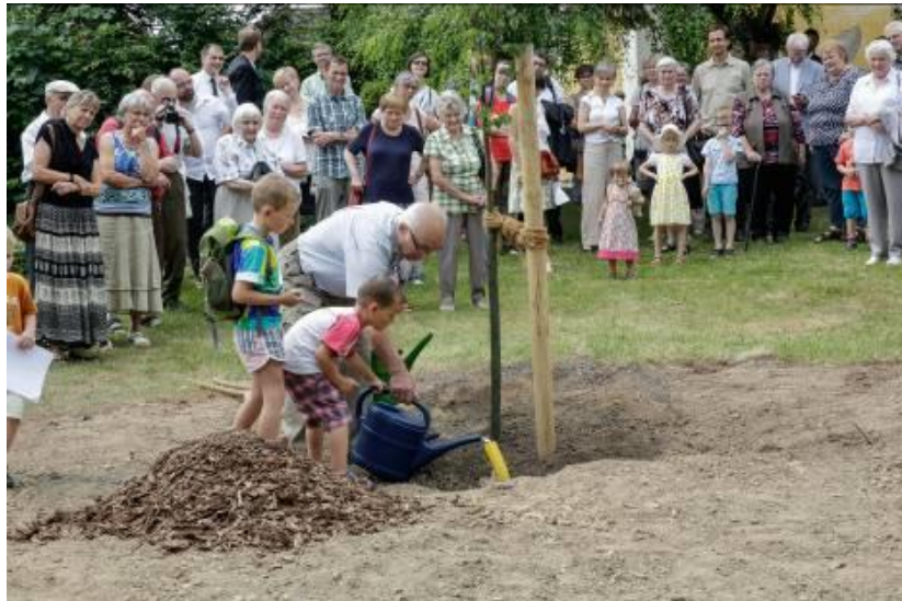
Pflanzung der Lutherlinde in Hochkirch