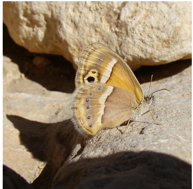
C. saadi in Fars/Iran